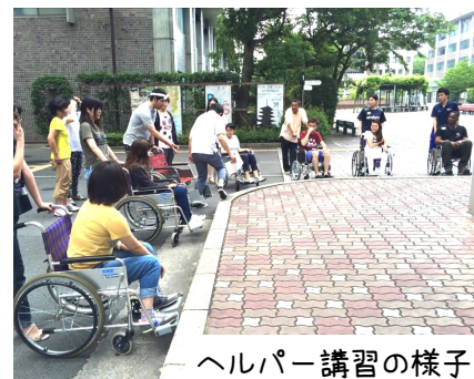
ヘルパー講習の様子

重度障害者の在宅生活を支えるため、学生のヘルパーさんを大募集中です！学生生活の間に新しいことに挑戦してみませんか？あなたが輝ける場所は“ゆに”にあるかも！